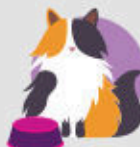
Koty ze skłonnością do nadwagi